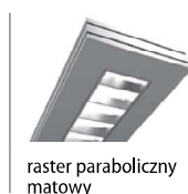
raster paraboliczny matowy