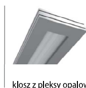
klosz z pleksy opalowej